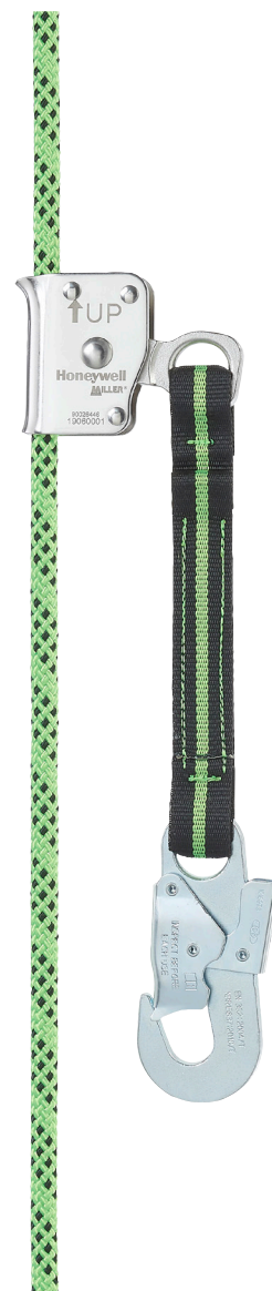
Automatisches RG300, Ø11 mm mit Anschlag 5 Meter