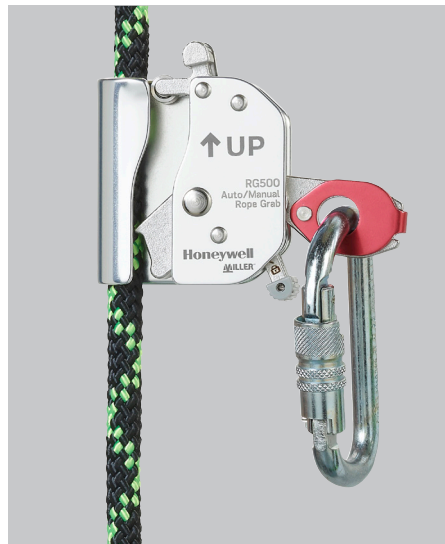
RG500 Auto/manuell, Ø12 mm ohne Positionierungsseil-Erweiterung