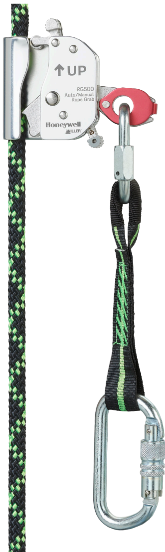
RG500 Auto/manuell, Ø12 mm mit Positionierungsseil-Erweiterung 0,3 m

• Nicht abnehmbares RG300 für das Baugewerbe: Für Anwender, die die Produktivität mit einer einfachen und einsatzbereiten Lösung steigern (leichtes, ergonomisches und vorinstalliertes mitlaufendes Auffanggerät) und zugleich Risiken minimieren müssen (Kantenfestigkeit und Gerät vorinstalliert)